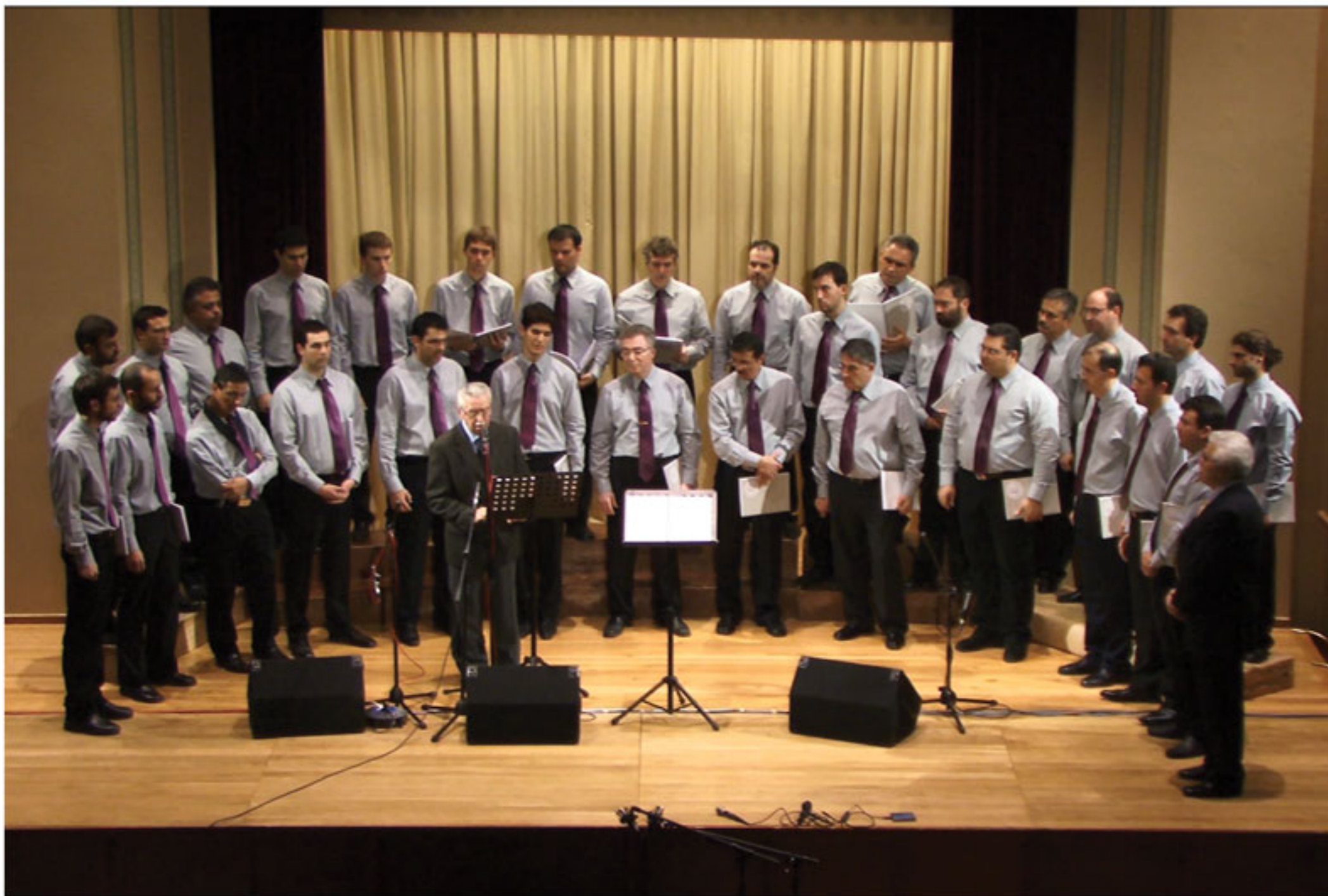
Σχεδιασμός Δ.Θεοδωρόπουλος, Ι.Λιτοντσενκο, Δ.Μαρλαχκούτσος Ηχοηψία Fab Liquid Studios Περεβοθ Ζιναυδα Ε. Οθορνεθα Translation Ιωανη Λιτοντσενκο Ευχαριστούμε τον Φιλολογικό Σύνλλογο 'Παρνασσός' και τους Μόνικα Χριστοδούλου, Λεωνίδα Οικονόμου, Γιάννη Παναγιωταράκο, Στέλιο Πολίτη, Δημήτρη Μπόρση, Νίκο Τουμπανάκη.